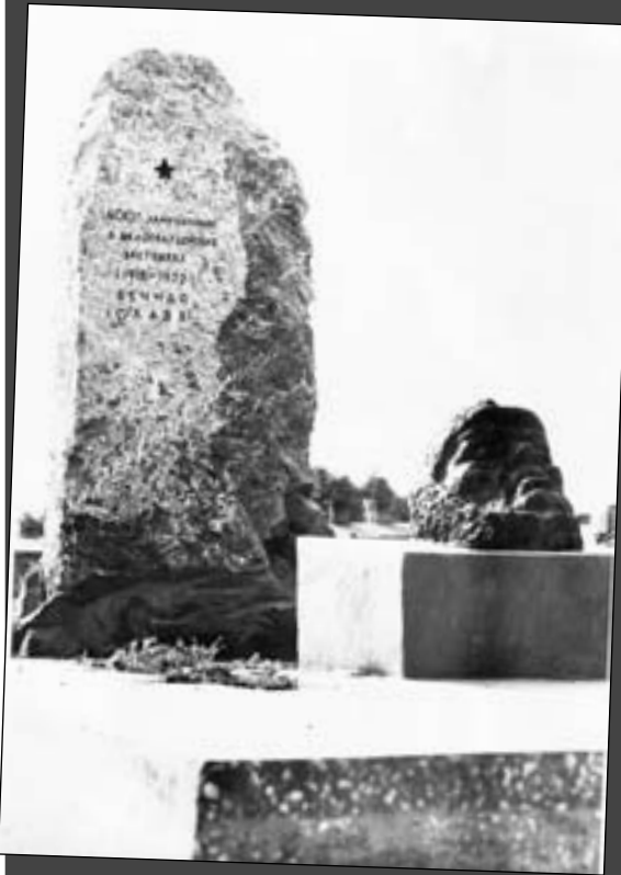
Фотография памятника «Четырехсот замученных» 60-х годов прошлого века. Охранное обязательство по уходу за ним теперь несет воинская часть 92088.